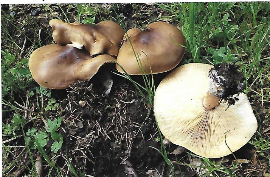
Obr. 12. Tmavobělka žlutavá – Melanoleuca cognata . Fotografoval Jan Kramoliš.